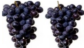
les grappes de raisin